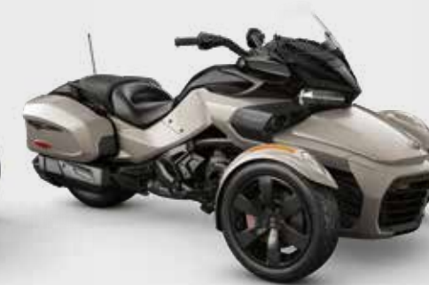
TITAN LIQUIDE MÉTALLIQUE