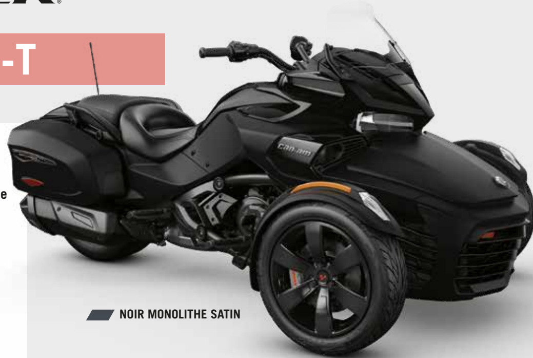
NOIR MONOLITHE SATIN