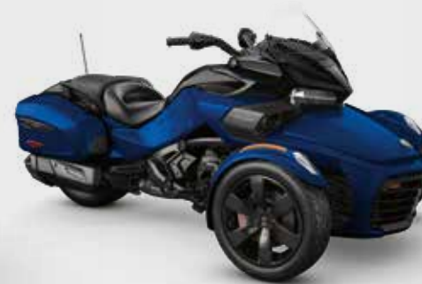
BLEU OXFORD MÉTALLIQUE