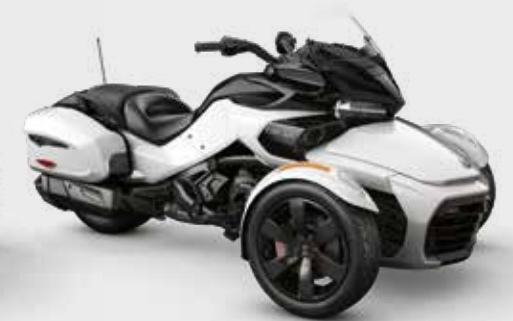
TITAN LIQUIDE MÉTALLIQUE